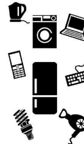
BALÍKOVÝ SVOZ DO 100 KG